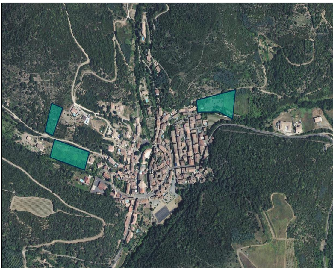
Figure 1: Localisation des futurs projets d'urbanisation de la commune de Saint-Nazaire-de-Ladarez